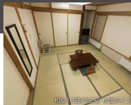
和室10畳[全2室・布団タイプ]