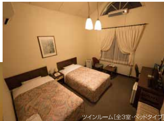
ツインルーム[全3室・ベッドタイプ]