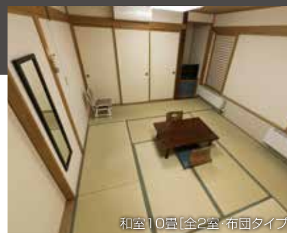
和室10畳[全2室・布団タイプ]