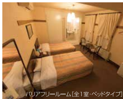
バリアフリールーム[全1室・ベッドタイプ]

観光・産業の中心部「いにしえ街道」に位置し、町内外各所へのアクセスが良く、宿泊地として最適です。函館市・松前方面へはバスやお車で、奥尻島へはフェリーをご利用下さい。