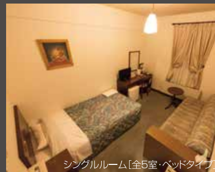
シングルルーム[全5室・ベッドタイプ]