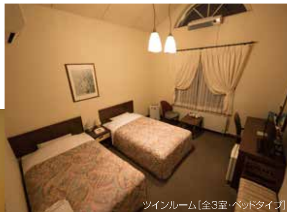
ツインルーム[全3室・ベッドタイプ]