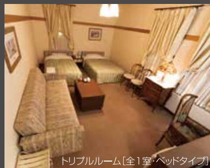
トリプルルーム[全1室・ベッドタイプ]